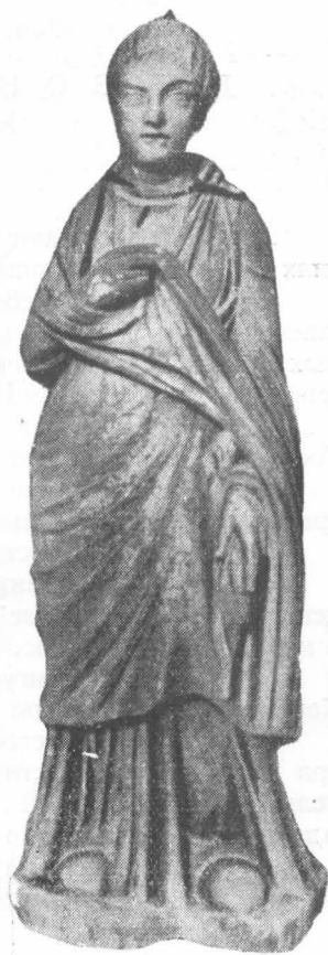
Fig. 3. — Constanța. Statuia unei tinere.

Apoi, complexul arheologic dezvăluit de curînd pe locul Șantierului nr. 8 de construcții, pare să ridice una dintre problemele foarte interesante asupra perioadei tîrzii de existență a Tomisului: aceea a distrugerii suferite de pe urma migrațiilor.